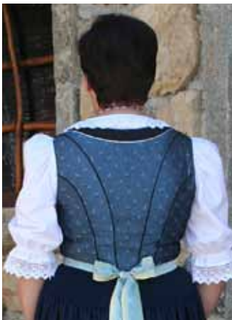
So ein Rücken kann entzücken: passepoierte Nähte stehen für die vielen Reit- und Wanderwege.