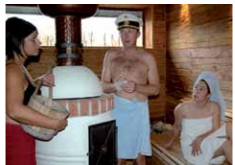
KRIMI DINNER „Der letzte Aufguss“

Anmeldung: Hotel Lebensquell, 07263/7515