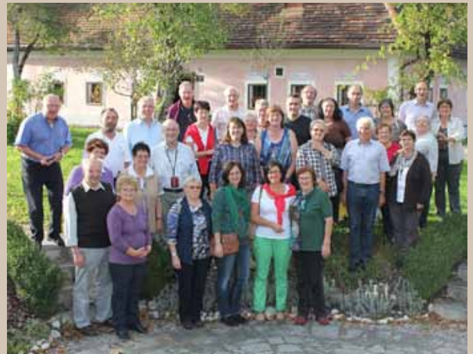
Gute Stimmung herrschte beim ersten Vereinsausflug der Zeitbank55+ nach Molln. Zum Abschluss wurde in Pierbach eingekehrt.

hilfe in organisierter Form und Nächstenliebe zählen zu den Schwerpunkten des gemeinnützigen Vereins. Die geleisteten Stunden werden gutgeschrieben und können eingelöst werden, wenn man selber Hilfe benötigt. Jede Stunde ist gleich wert. Leistungsdruck hat in der Zeitbank keinen Platz. Ziel ist, dass die Mitglieder möglichst lange in vertrauter Umgebung hohe Lebensqualität genießen können. Interessierte sind bei den Stammtischen sehr willkommen. Näheres unter www.zeitbank.at unter „Vereine“ > Zeitbank55+ Mühlviertler Alm.