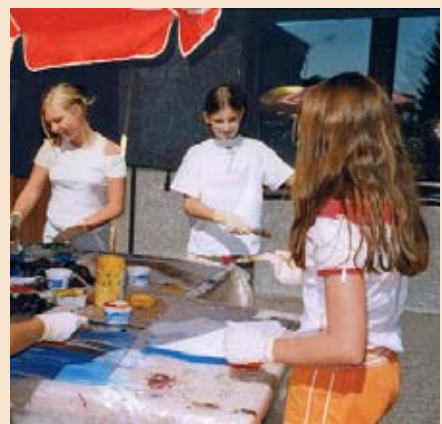
Keineswegs fad: die letzten Ferientage

Selbstversorger-Küche zubereitet – 65 Euro. Inklusive sind außerdem die Workshops (Filzen, Trommeln, Mobilebasteln, Jonglieren, Outdoor-Spiele...), die Benützung von Turnhalle und Schwimmbad. Die Teilnahmegebühr wird vor Ort eingehoben. Mitzubringen sind Badebekleidung, Hallenturnschuhe, Tischtennisschläger, Toiletteartikel, Bettzeug (= Leintuch, Polster- und Tuchentüberzug), warme Kleidung, Regenschutz, gutes Schuhwerk und vor allem viel gute Laune. Anmeldung im Karlingerhaus, 4280 Königswiesen, Schulstraße 46, Telefonnummer: 07955/6344.