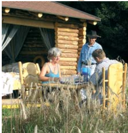
Einzigtages Schlafenerlebnis verspricht das Bett im Kornfeld in St. Georgen/W.

mationen sind im Internet unter der Adresse www.einbettimkornfeld.at zu finden.