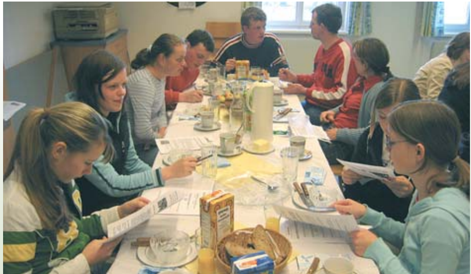
Biofaire Jause in Kaltenberg: Die Jugendlichen sind mit Begeisterung bei der Sache.