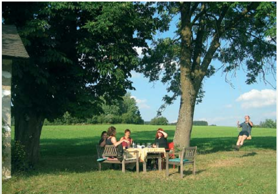
Gemütliche Rast bei Freunden – das Wandernetzwerk macht's möglich!