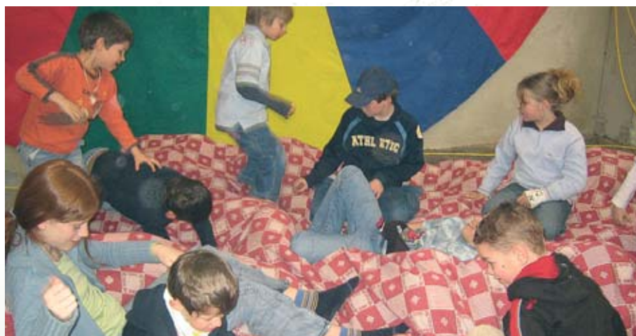
Lebendig: Das mietbare Hüpfkissen der Textilwerkstatt hatte viele „Passagiere“.

Diskutieren Sie mit uns oder schreiben Sie uns: j.greindl@muehlviertleralm.at