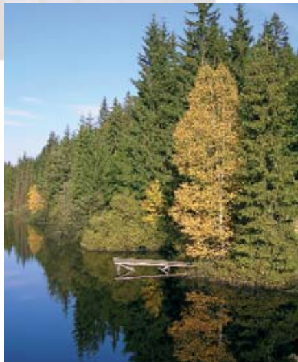
Naturjuwel Tannermoor: Der Moorwanderweg wird 2006 weiter verbessert.

Trotz gleich bleibender Nächtigungszahlen (rund 55.000 pro Jahr) spürt man die positive Stimmung in der Region. Besonders der Tagesausflug erfreut sich in unserer Region großer Beliebtheit. Die Zentralraumkampagne – Leader-Leitstrategie im EU-Entwicklungsprogramm der Mühlviertler Alm 2000 bis 2006 – hat ihre Wirkung gezeigt. Die Linzerinnen und Linzer sind aufmerksamer auf unsere Region geworden. Dazu wurden in den vergangenen Jahren etliche Ausflugsziele neu belebt, errichtet und entwickelt. Als absoluter Leitbetrieb hat sich der Jagdmärchenpark Hirschalm zu einem oberösterreichweit anerkannten und führenden Familienurlaubsbetrieb entwickelt. Die Stoaninger Alm mit der ersten „Speed-Gleitbahn“ in Oberösterreich ist ebenfalls bekannt und beliebt. Durch die Revitalisierung ziehen die Burgruine Rutenstein mit der Schutzhütte und die Ruine Prandegg jährlich rund 15.000 Besucherinnen und Besucher an. Der einzigartige oö. Jagdfalkenhof in St. Leonhard, das Weihnachtsmuseum in Harrachstal/Gemeinde Weitersfelden, das entstehende Häferlmuseum in Pierbach, das landwirtschaftliche Gerätemuseum in Komau/Liebenau, die Karlinger Hammerschmiede an der Kleinen Naarn in Unterweißenbach, die Gasthaus-