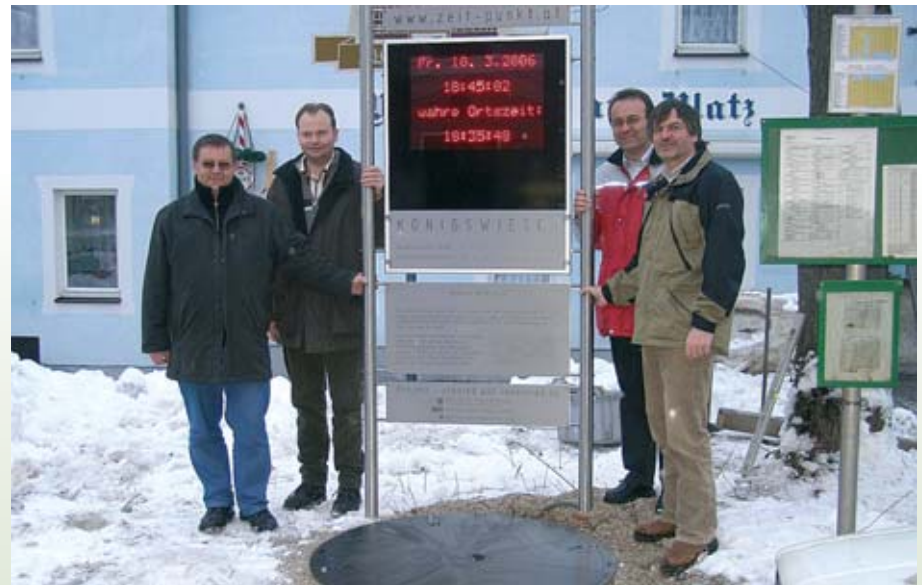
Die „digitale Sonnenuhr“ in Königswiesen entwickelt sich zur Gäste-Attraktion.

KÖNIGSWIESEN. Mit der Neudaptierung von drei Räumen im Obergeschoß wurde die Ausstellungsfläche im Heimathaus Königswiesen wesentlich vergrößert. Erstmals sind Ausstellungsgegenstände im Bereich Sattlerwerkzeuge, Zimmermanns- und Holzbearbeitungswerkzeuge, alte Musikinstrumente und Trachten der Musikkapelle Königswie-