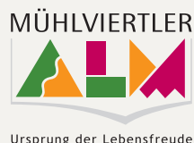
Ursprung der Lebensfreude