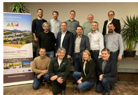
Die Steuerungsgruppe des Projekts