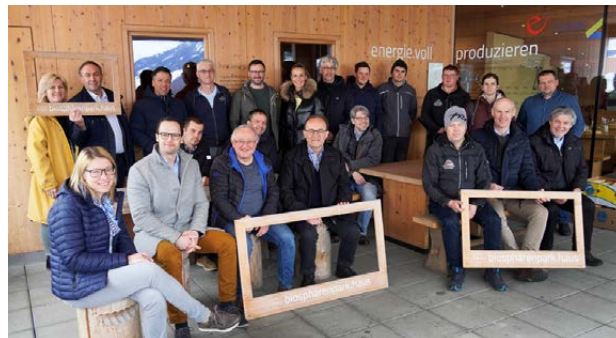
Die Exkursionsgruppe der Mühlviertler Alm im biosphärenpark.haus im Großen Walsertal.

Mit der 3-tägigen Holzbauexkursion nach Vorarlberg konnte die Klima- und Energiemodellregion Mühlviertler Alm gemeinsam mit der gleichnamigen LEADER-Region einen wichtigen Schritt zur Markenentwicklung Richtung nachhaltigen Holzbau setzen. Regionalen Leitbetrieben aus Zimmererei und Holzverarbeitung, Lehrlingen, Architekten sowie wichtigen Vertretern aus Landwirtschaft und Kommunalpolitik, wurden im Rahmen der Exkursionsreise hochkarätige Einblicke in die Traditionsschmieden des Vorarlberger Holzbaus gewährt. Am Programm standen zehn ausgewählte Exkursionsziele, die durch den Bregenzerwald zu den Werkstätten und Objekten international prämierter Holzbauprojekte, wie dem imposanten Dorfsaal in Mellau oder dem Multifunktionszentrum in Ludesch führten. Spannende Vorträge,