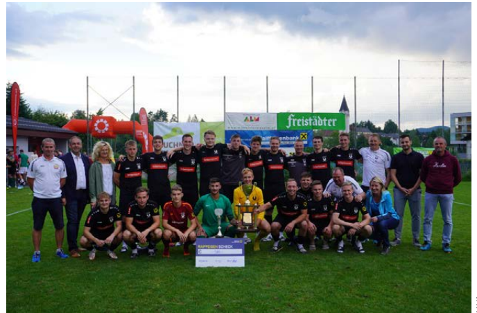
Königswiesen durfte sich im letzten Jahr bereits zum 2. Mal über den Gewinn des Mühlviertler Alm Fußball-Cups freuen.

Die Union Kaltenberg und alle Beteiligten hoffen auf traumhaftes Fußballwetter und auf zahlreiche Fans, die ihre Teams lautstark anfeuern.