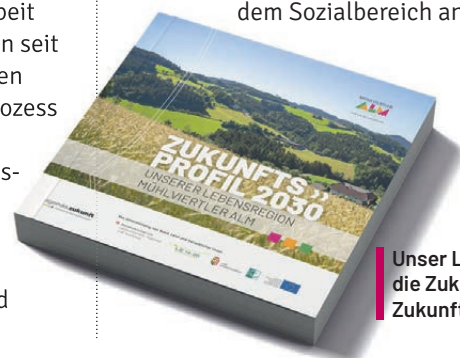
Unser Leitfaden für die Zukunft: Das Zukunftsprofil 2030

Heute umfasst der Verband Mühlviertler Alm zehn Mitgliedsgemeinden auf 456 Quadratmetern, mit einer Gesamtbevölkerungszahl von etwa 17.800 Personen. Dem Vorstand der Mühlviertler Alm gehören derzeit 27 VertreterInnen aus den zehn Mitgliedsgemeinden, sowie aus Organisationen wie dem Tourismusverband Mühlviertler Alm Freistadt, den Mühlviertler Alm Bauern, des Reitverbandes Mühlviertler Alm, der Jugendtankstelle, der Wirtschaft, aus dem Bildungsbereich und dem Sozialbereich an.