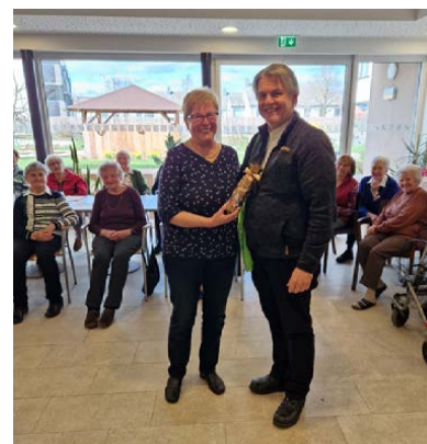
ZEITBANK TREFF BAD ZELL

Für sie ist es wichtig, dass die Treffpunkte aus dem Leben heraus entstehen. Ihr Know How kann sie gerne zur Starthilfe für ähnliche Projekte zur Verfügung stellen.