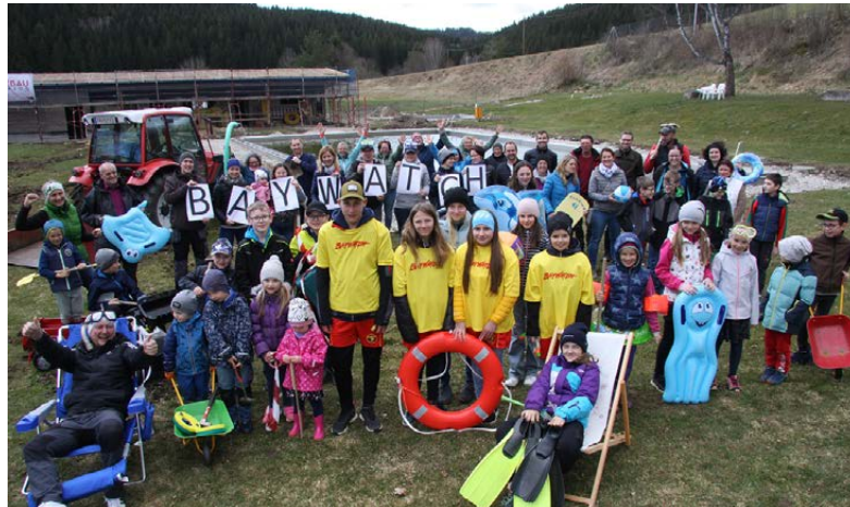
Die Mitglieder des Vereins „BAYWATCH“ freuen sich nach großartigem Engagement auf das neue attraktive Freibad.

Mitglieder beim Verein und es wurden bis heute 30.000 Euro gesammelt, die nun in die Sanierung bzw. Attraktivierung fließen. Das Freibad war in den letzten vier Jahrzehnten nicht nur für Weitersfelden eine wichtige Freizeit- und Erholungsan-